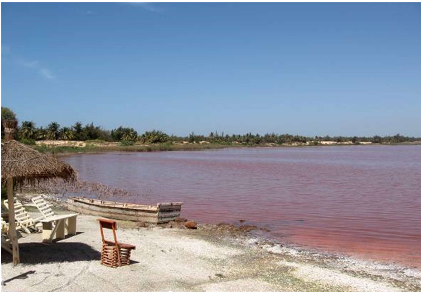
Le Lac Rose et Hôtel le Trarza